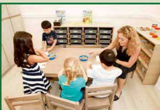
另外一組的學生在老師的指導下，進行其他學習活動。

「大仔一直在Woodland的另一所分校就讀，我們覺得學校的教學氣氛很好，所以當知道Woodland在堅尼地城開辦分校之後，我們特別安排細仔入讀。我們很喜歡校園的懷舊設計，小朋友每天穿梭在不同的場景中，玩得很開心。我們也很欣賞學校的老師會因應學生的個別程度，在課堂的各個環節中，融入不同元素，讓學生享受學習的樂趣。記得有一次兒子和同學以麵粉進行學習活動，玩得亦樂乎；在活動完結後我本想幫忙清潔，卻被老師阻止，說小朋友自行清理也是玩耍的一部份。我很欣賞校方給小朋友很多自由探索的機會，同時也訓練了他們的自理能力和責任感，讓孩子從中得以成長。」