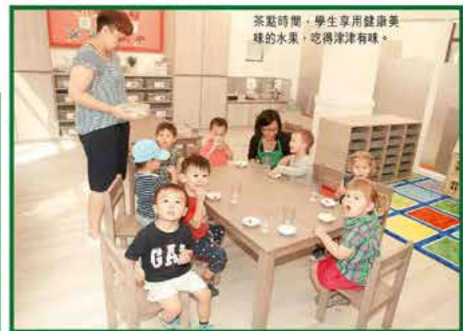
茶點時間，學生享用健康美味的水果，吃得津津有味。