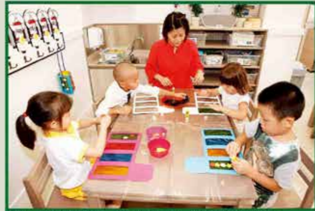
課室內，學生分組進行活動，其中一組在做動作，盡情發揮他們的藝術創意。