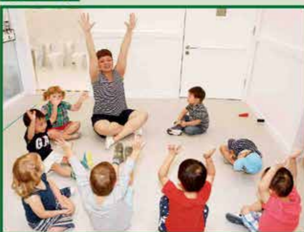
學生在Kids in Motion活動中，跟著老師做動作，有助幼兒的肌肉發展。