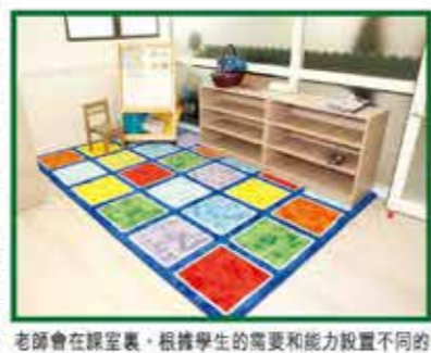
老師會在課室裏，根據學生的需要和能力設置不同的學習區域。