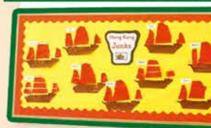
壁板上貼著學生製作的紙帆船。