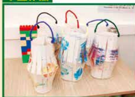
學生製作色彩繽紛的燈籠，一同歡度中秋節。