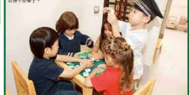
不同國籍的學生聚在一起「打麻將」，玩得亦樂乎。